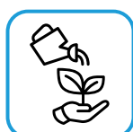
Jardin et loisirs